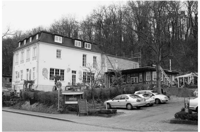
Die Bauarbeiten am Standhotel schreiten zügig voran

Weitere Reibungspunkte mit der Naturparkverwaltung wurden beim Naturparkkuratorium durch die Stadt benannt. So sind das u. a. die nicht ausreichende Beräumung der Zu- und Abflüsse der fließenden Gewässern durch den Wasser- und Bodenverband. Der sich auf die Einflussnahme des Naturparks beruft. Die Stadt fordert weiterhin eine Beräumung des Wanderweges durch die Silberkehle, der jahrelang nicht mehr als Wanderweg genutzt werden konnte, obwohl er als zertifizierter Wanderweg „Naturparktrail“ gekennzeichnet ist. Auf unseren Widerspruch zur Stellungnahme des Ministerium für Umwelt Gesundheit und Verbraucherschutz, zum FNP wurde uns seitens des Mi-