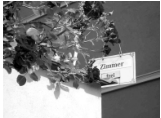
... die Rosenstadt lädt ein...