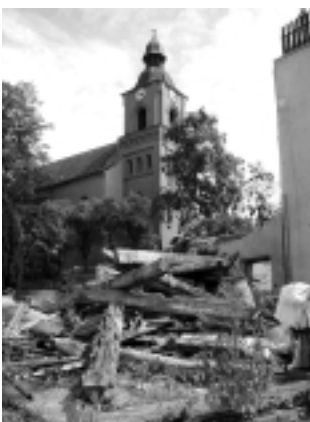
Bauvorbereitungen für ein neues Haus Am Markt 3

Für Freitag, den 09. September 2005, 18:00 Uhr lädt die STEG Stadtentwicklung Südwest gemeinnützige GmbH als treuhänderischer Sanierungsträger der Stadt Buckow alle interessierten Bürger zu einer Informationsveranstaltung in das Rathaus der Stadt ein.