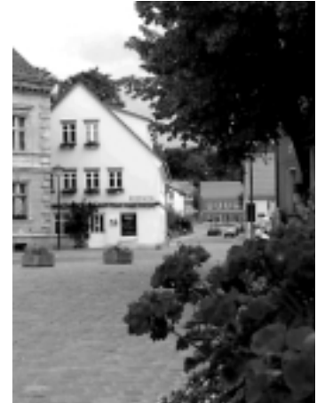
Schöne Ansichten - Am Markt