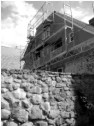
jüngstes, liebevoll realisiertes Bauprojekt: Am Roten Haus/Königstr. 54