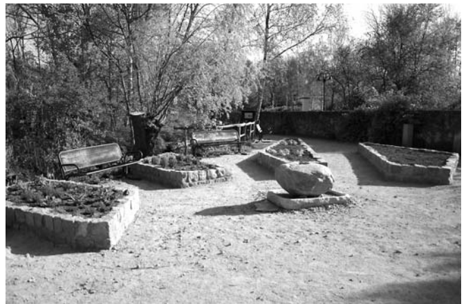
Kneipp-Kräutergarten hinter dem „Alten Warmbad“